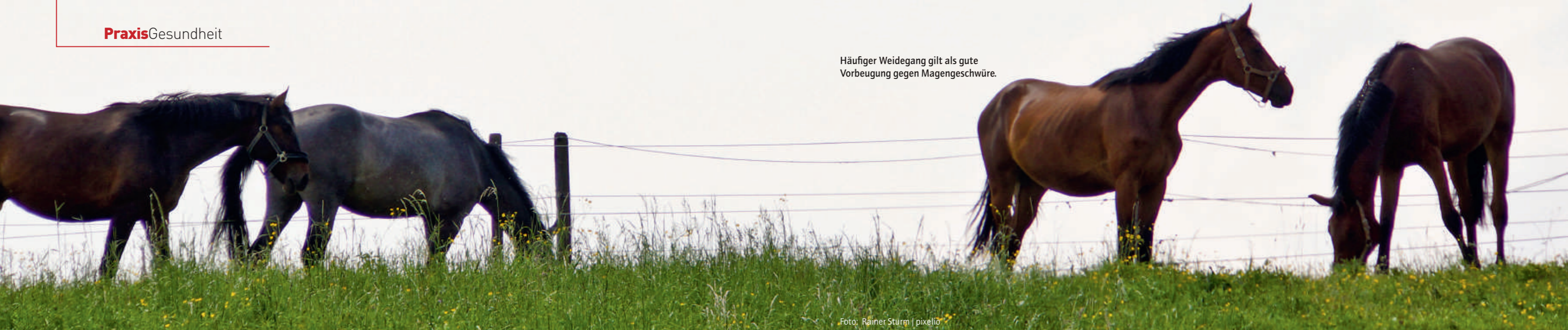
Häufiger Weidegang gilt als gute Vorbeugung gegen Magengeschwüre.